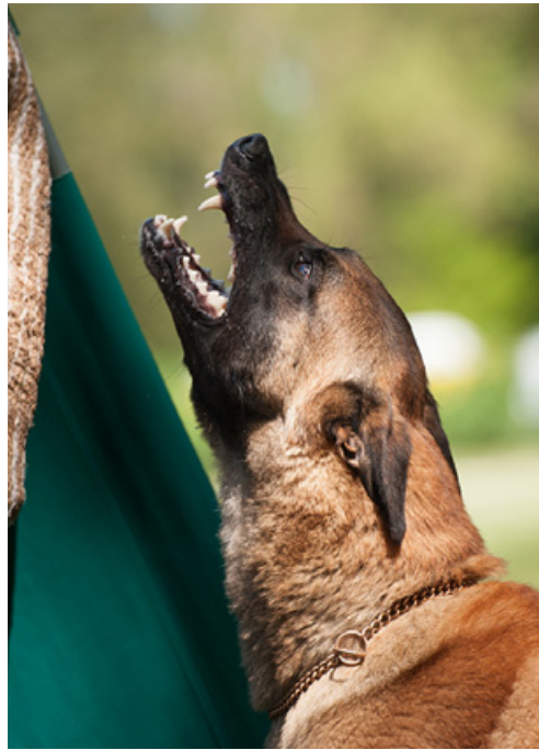
Ambos von der Flammenbrut