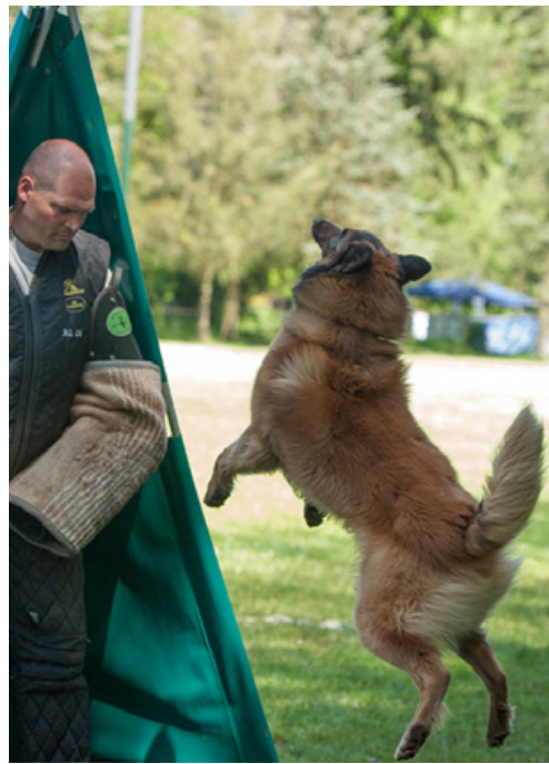
Cashew vom Forster Hexenkessel