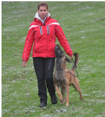
Daimon vom Hause Ritter