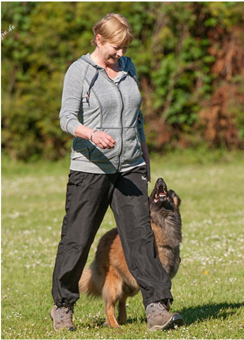
A Sky full of Stars