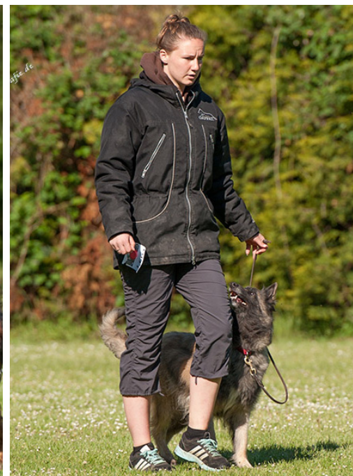
Xira vom Waidli