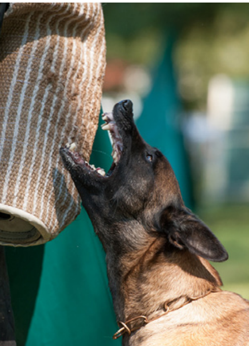
Anouk von der Königskobra