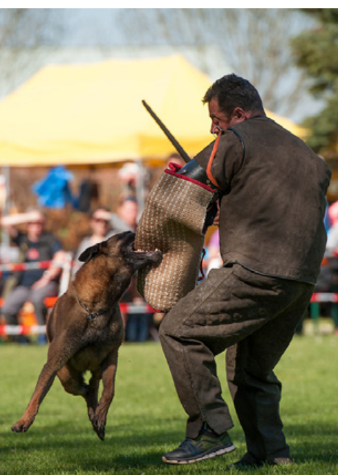
ers Da Capo