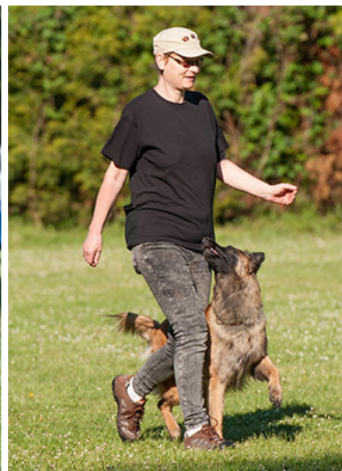
Indira Gandhi du Jardin du Malezy