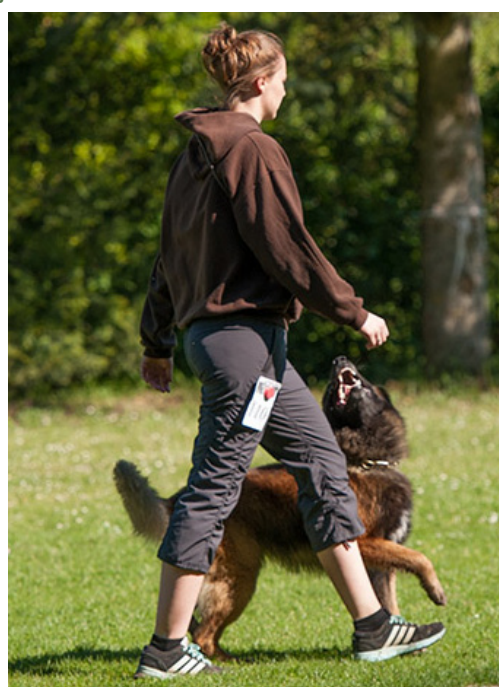
Ufo zum Chasseralblick