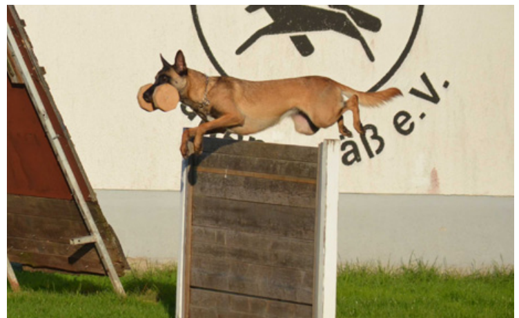
Araika vom Hause Ritter