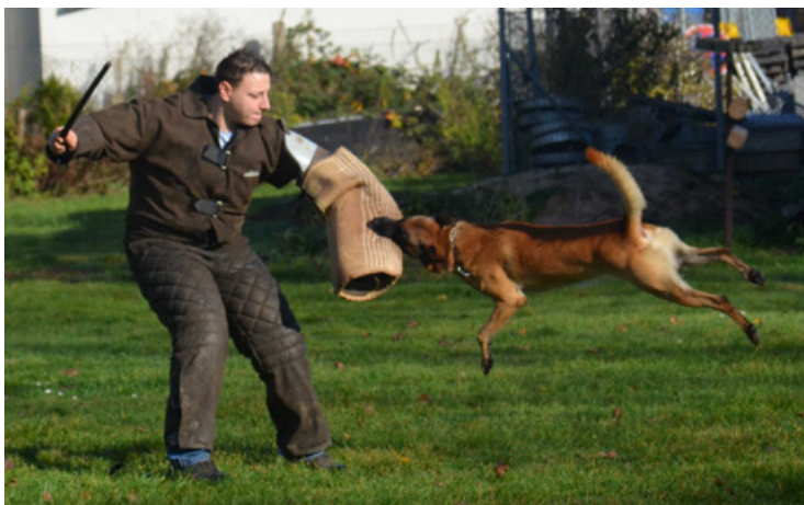
Amun-Thunder vom Hause Ritter