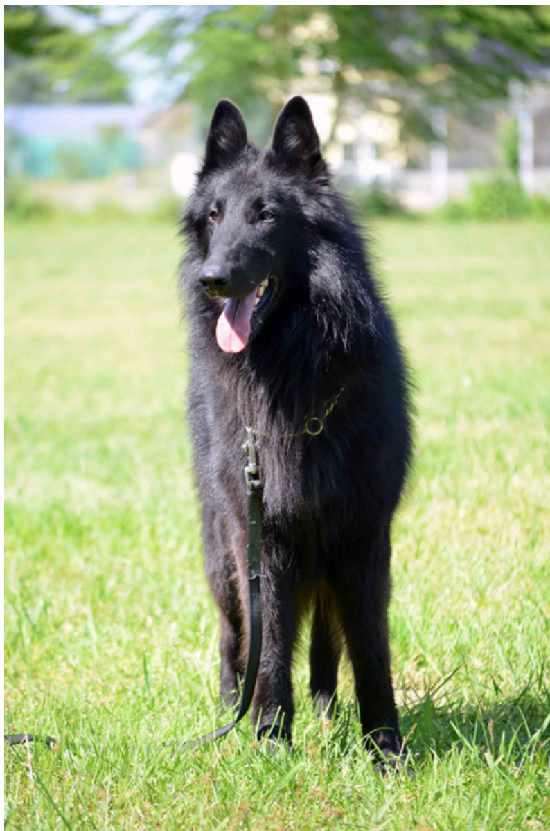
Jason des Jardins d'Ebene