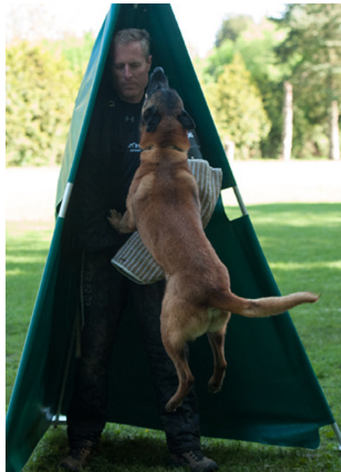
Fizzy du Hameau de Valbonne