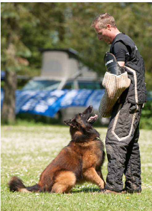
Caine von Scathach