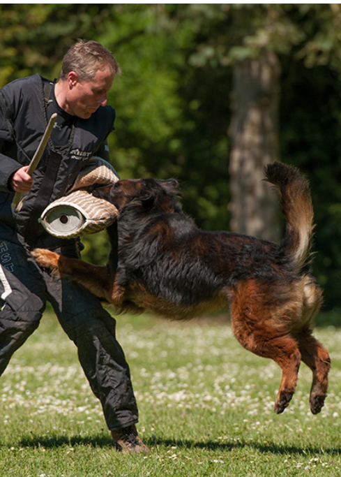
Hugo vom Hause Gürtler